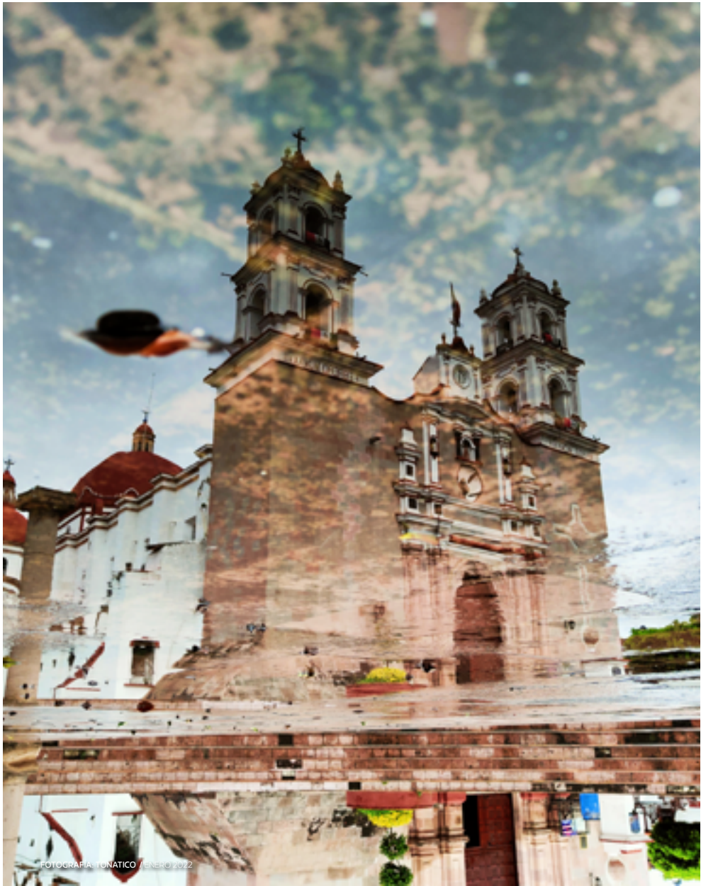
FOTOGRAFIA TONATICO JENERO 2022